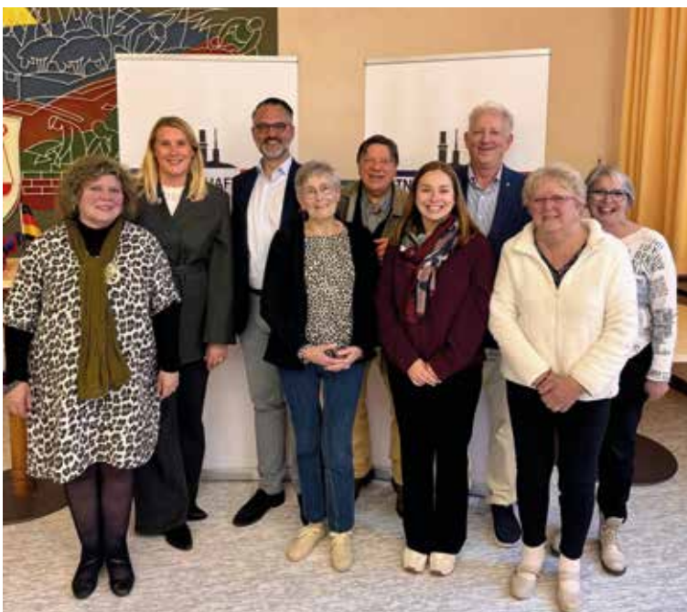
Gruppenbild mit den Vertretern der Partnerschaftsvereine und Kommunen.