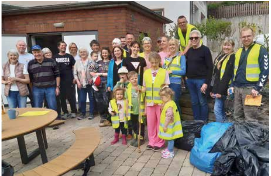
Erfolgreiche Müllsammelaktion mit vielen helfenden Händen in Hunoldstal.

Besonders bemerkenswert ist die breite Unterstützung innerhalb der Gemeinde: Schulen, Kindergärten, Feuerwehren, Firmen, Gaststätten sowie zahlreiche Privatpersonen beteiligen sich regelmäßig an den Aktionen. Inzwischen existieren mehr als 150 eingetragene Patenschaften. Insgesamt engagieren sich mehr als 500 Menschen in Schmittener aktiv gegen Müll und Umweltverschmutzung.