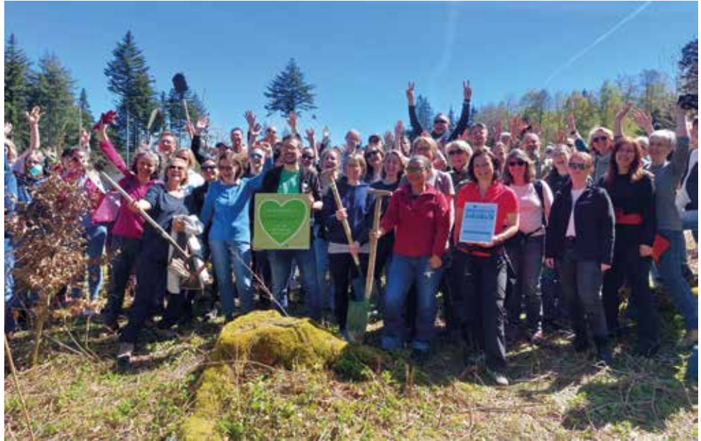
Gemeinsam anpacken

Die App verbindet Menschen direkt mit „ihrem“ Wald: Pflanzaktionen, Waldpflegeeinsätze und Baumstandorte können dokumentiert und begleitet werden. Gleichzeitig ermöglicht die Plattform, Pflegebedarfe oder Schäden direkt zu melden – etwa defekten Wildschutz, umgestürzte Bäume oder stark überwachsene Pflanzflächen.