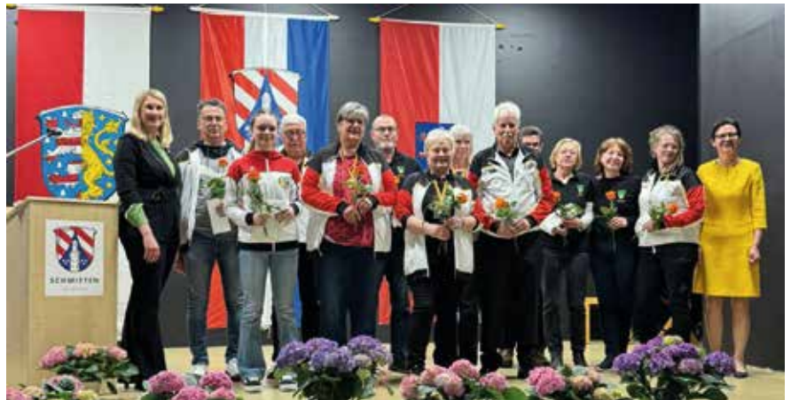
Die Sportler vom Schützenverein Finsterthal-Hunoldstal e.V. hatten 2025 das erfolgreichste Jahr in der Vereinsgeschichte.