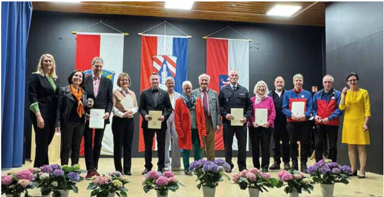
Aufstellen zum Gruppenbild: Die Träger der Bürgermedaille 2026.