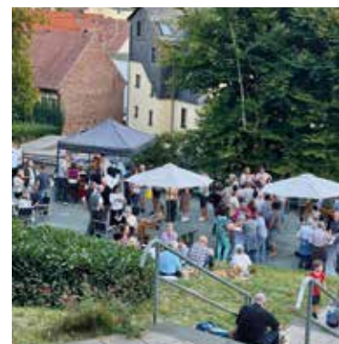
Neugestaltung Park in Schmittener Höhe | Seite 25