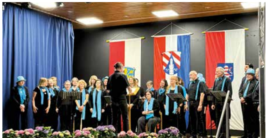
Auftritt ChORONA Reifenberg unter der Leitung von Christian Hauck.