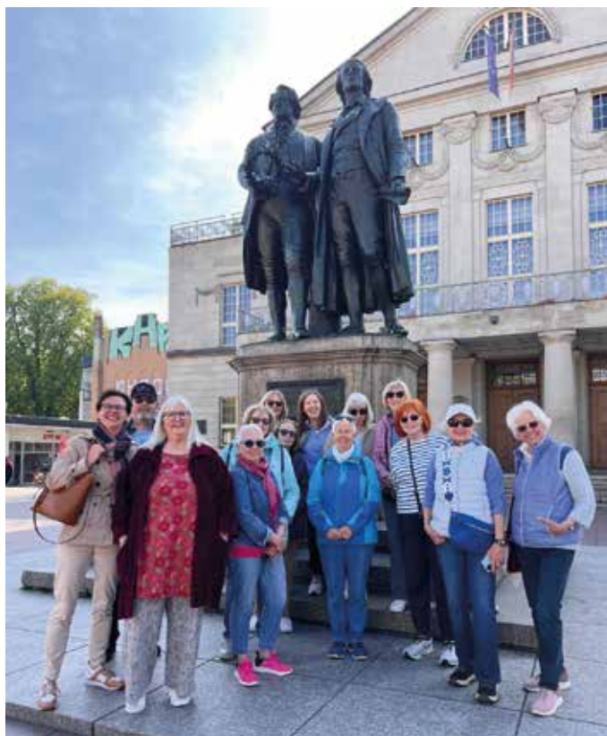
Die begeisterte Reisegruppe in Weimar.

Ein kurzer Fußmarsch führte uns zum Schillerhaus. Als man die Gebeine des „Dichters der Freiheit“ 21 Jahre nach seinem Tod aus einem Massengrab barg, stellte Goethe ehrfürchtig Schillers Schädel auf seinen Schreibtisch, bis dieser in der Fürstengruft beigesetzt wurde. Eine DNA-