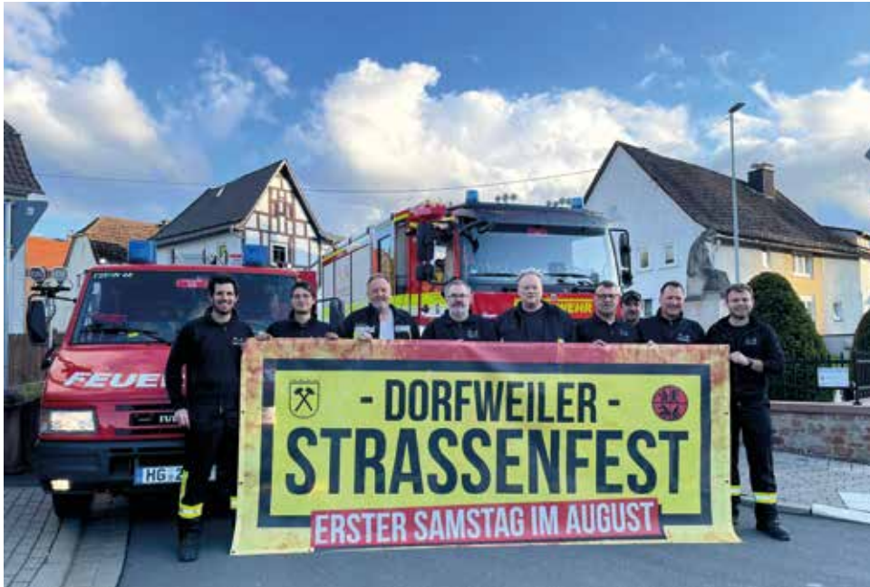
Die Einsatzabteilung der Feuerwehr Schmittener-Nord wirbt mit dem bekannten Banner schon für das diesjährige Straßenfest.

Es ist wieder so weit: Der Verein der Freiwilligen Feuerwehr Dorfweil lädt ein am 1. und 2. August