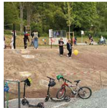
Ein Ort für die Jugend | Seite 14 – 15