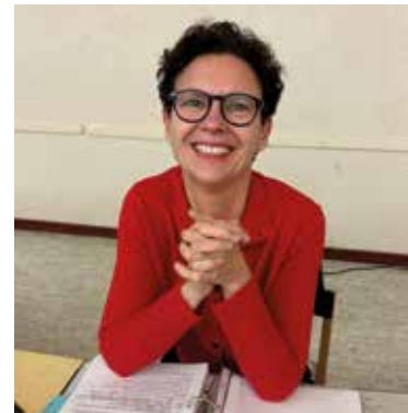
Ergebnisse der Kommunalwahl 2026 | Seite 6 – 7