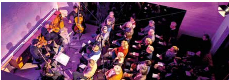
In der Wohnhalle treffen sich regelmäßig Kulturfreunde aus nah und fern.