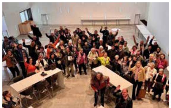
Gemeinsamer Tagesausflug am Freitag nach Wiesbaden in den Hessischen Landtag.