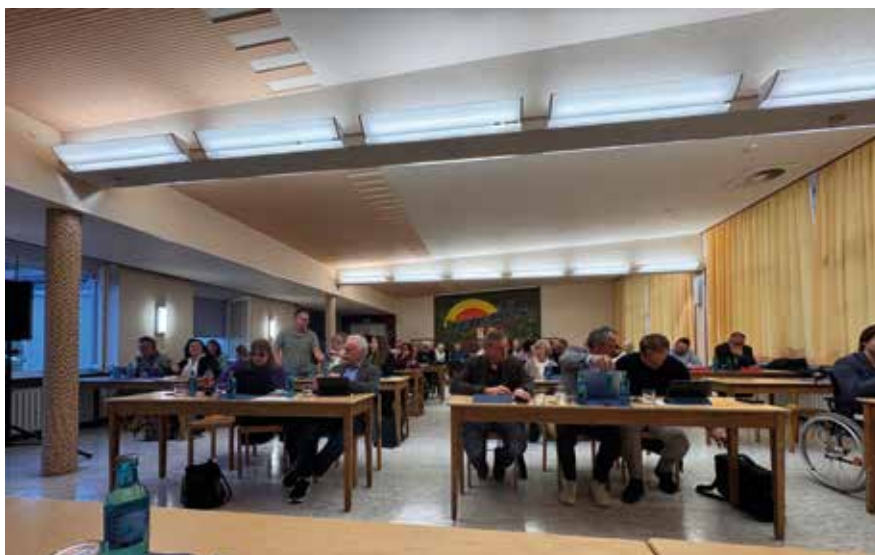
Sitzung der Gemeindevertretung im DGH Arnoldshain.