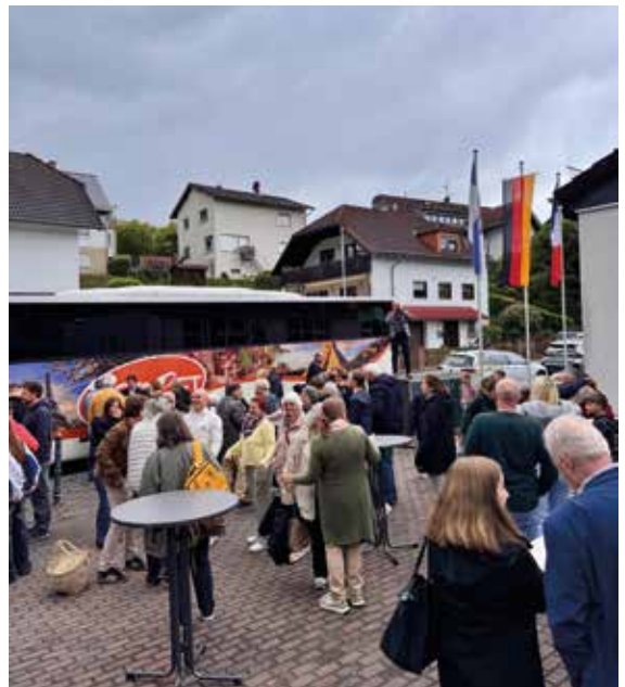
Ankunft der französischen Delegation am Donnerstagabend am DGH Arnoldshain.