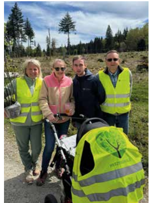
Die Herzenswald Familie gemeinsam unterwegs

Ein weiterer Schwerpunkt lag auf dem Thema Artenvielfalt. Gemeinsam mit Mitarbeitenden der Goldgas AG entstand auf einer Herzenswaldfläche ein großes Bienenhotel