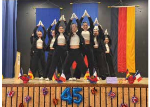
„Men in Black“ Tanzaufführung im Rahmen der Grande Fete.