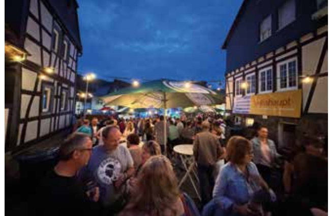
Dorfweiler Strassenfest 2025.

(Verein der freiwilligen Feuerwehr Dorfweil)