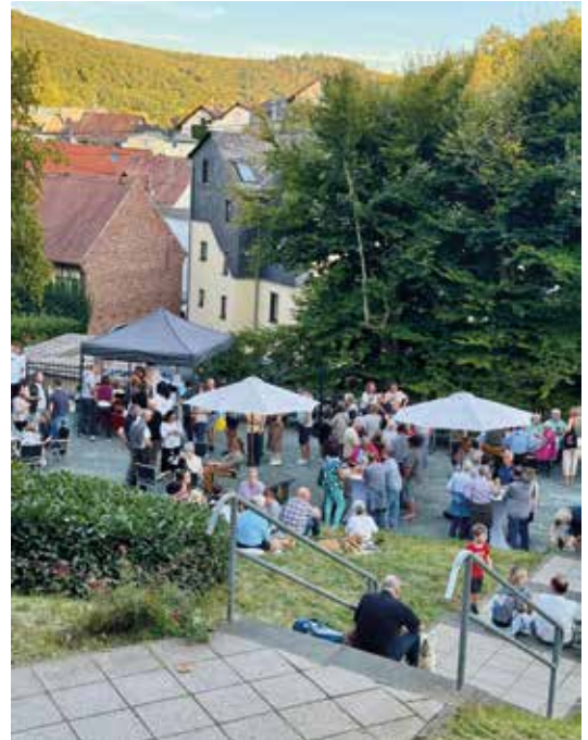
Der erste Probelauf für „Wein im Park“ im September 2025 hat gezeigt, das Event kommt an.

Ausblick: Das Konzept ermöglicht neue Veranstaltungen wie Wein im Park, Glühwein im Park, Pflanzentauschbörse, Klimatage in Schmitten, Wein & Kunst im Park und perspektivisch einen spezialisierten Abendmarkt als Ergänzung zu lokalen Geschäften. (gs)