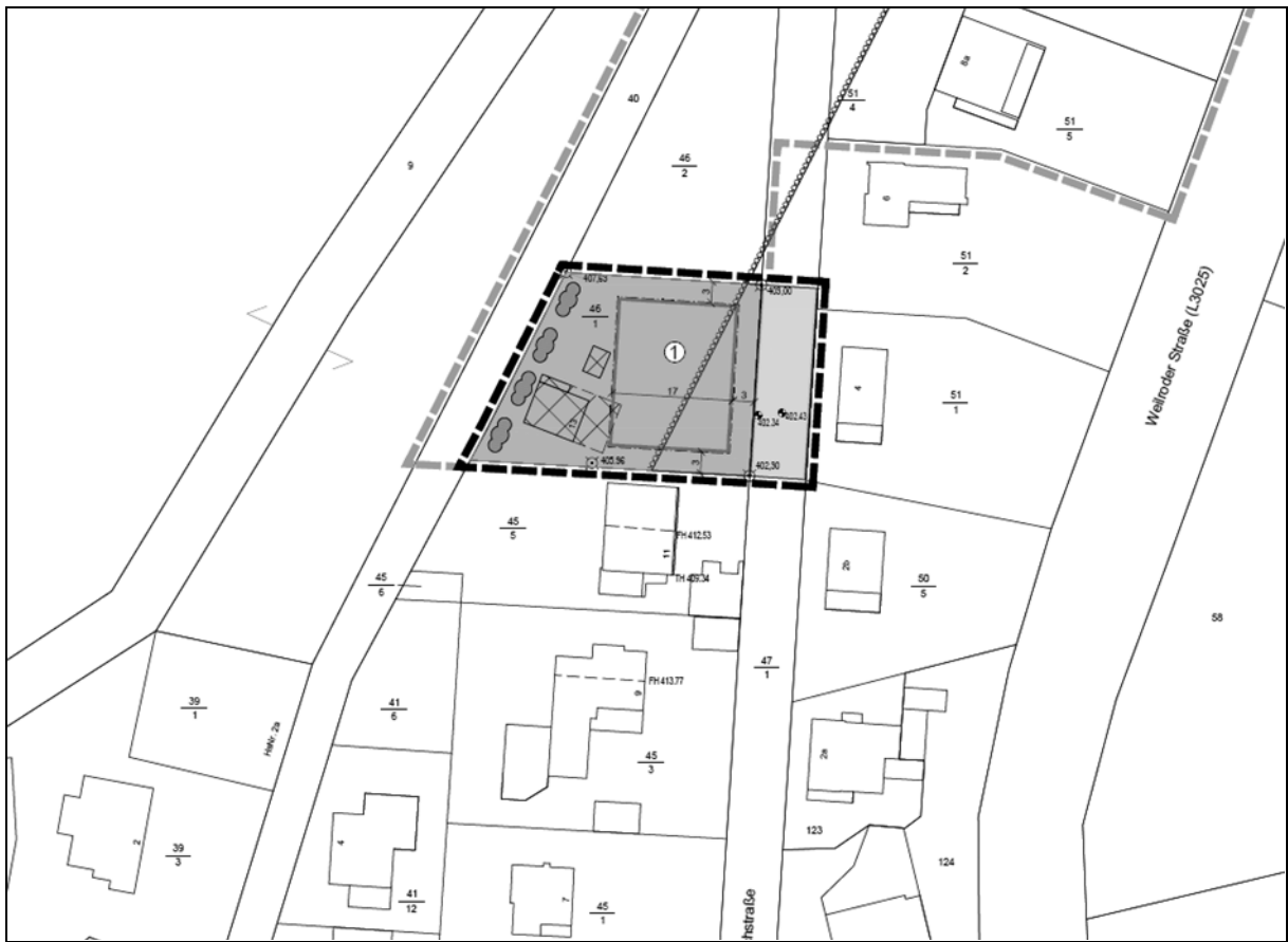
genordet, ohne Maßstab