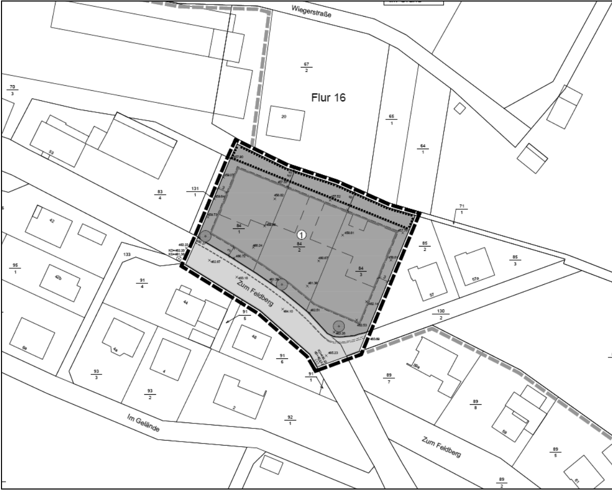
genordet, ohne Maßstab